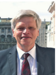
Dr. Martin Prunbauer Präsident des Österreichischen Haus- und Grundbesitzerbundes

„Der Österreichische Haus- und Grundbesitzerbund wurde zum Schutz und zur Förderung der gemeinsamen Interessen der Haus- und Grundbesitzer in ganz Österreich gegründet.“